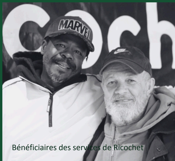
Bénéficiaires des services de Ricochet

Ricochet s'engage à développer et à offrir des solutions d'hébergement et d'accompagnement pour les personnes qui vivent de l'instabilité résidentielle dans l'Ouest-de-l'Île et les environs.