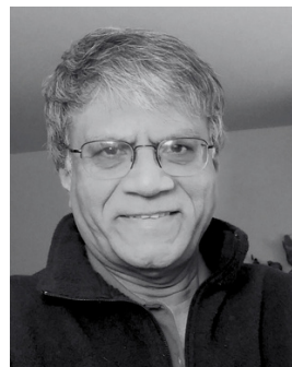
Jag Nara Simha Devara