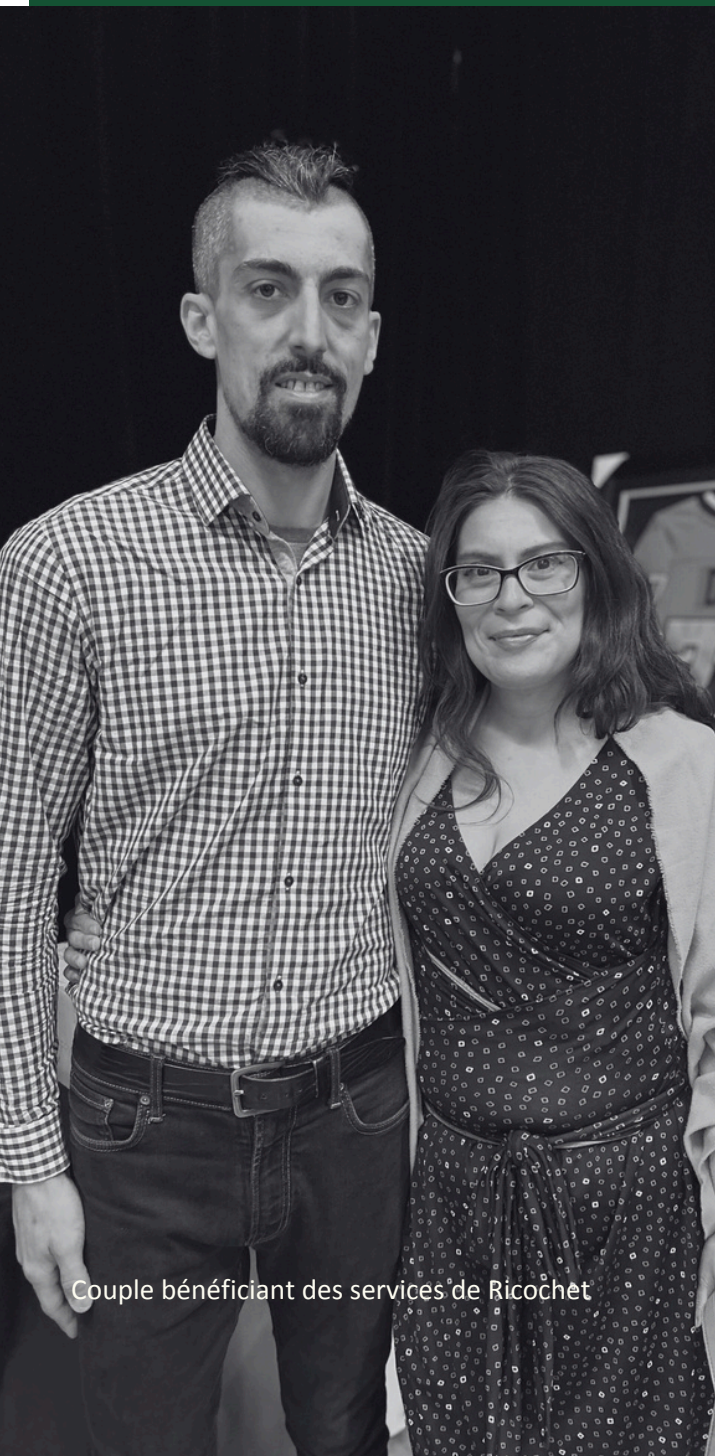
Couple bénéficiant des services de Ricochet

Traiter et prévenir les conditions dont souffrent les bénéficiaires et promouvoir leur intégration sociale en les soutenant dans une démarche d'appropriation du pouvoir (empowerment), et en fournissant un accompagnement psychosocial personnalisé, un service de référence et d'accompagnement ainsi que les éléments essentiels à la vie tels que de la nourriture, des meubles et des vêtements, au besoin.